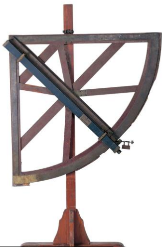
しょうげんぎ 象限儀 (中)