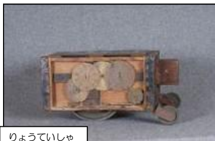
りょうていしゃ 量程車