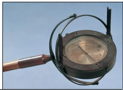
つえさきほういばん 杖先方位盤(わんからしん)