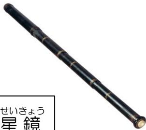
かんせいきょう 観星鏡