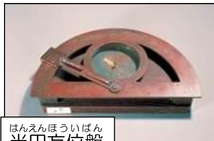
はんえんほういばん 半円方位盤