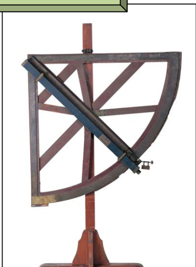
しょうげんぎ ちゆう 象限儀 (中)