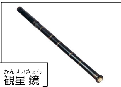
かんせいきよう 観星鏡