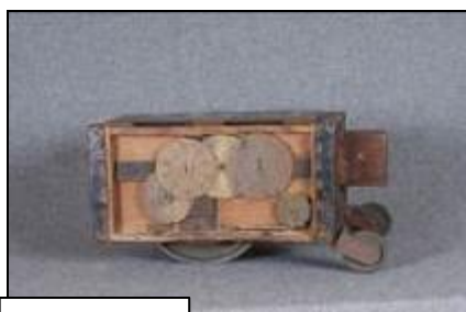
りようていしゃ 量程車