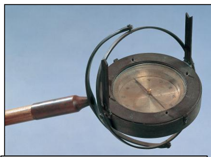
つえさきほういばん 杖先方位盤(わんからしん)