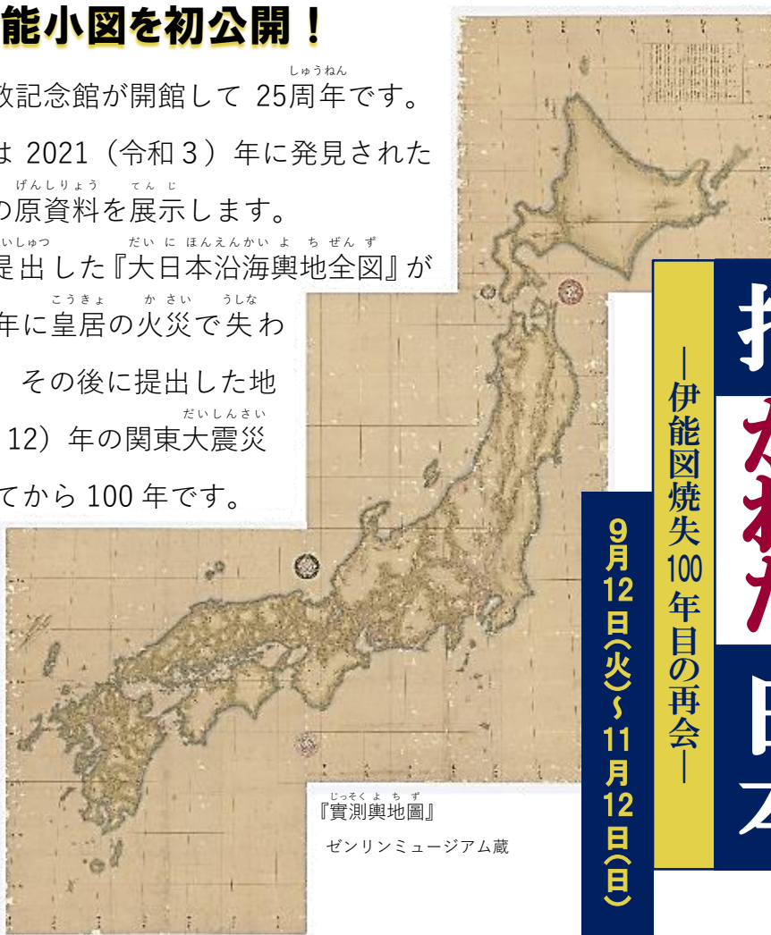
『實測輿地圖』 ゼンリンミュージアム蔵

この不思議（ふしぎ）な めぐり合わせの 年（きちょう）に貴重な伊能 小図（ま）を、ぜひ目 の当たり（ま）にして ください！