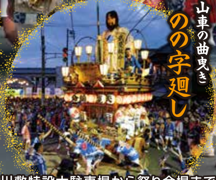
山車の曲曳きのの字廻し

佐原の大祭実行委員会・佐原山車行事伝承保存会 お問合せ ●香取市商工観光課 / tel.0478-50-1212 ●(一社)水郷佐原観光協会 / tel.0478-52-6675 ●佐原商工会議所 / tel.0478-54-2244