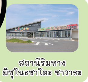
สถานีริมทาง มิซึโนะซาโตะ ซาวาระ