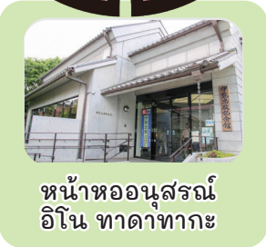
หน้าหออนุสรณ์ อิโนะ ทาดาทาเกะ