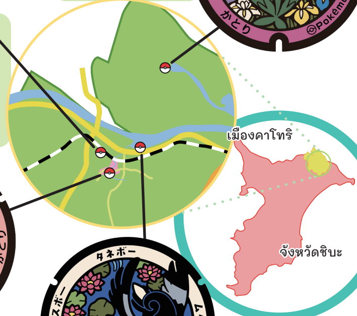
เมืองคาโทริ