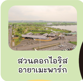
สวนดอกไอริส อายาเมะพารัก