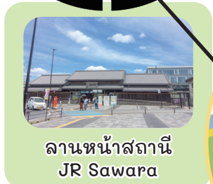
ลานหน้าสถานี JR Sawara