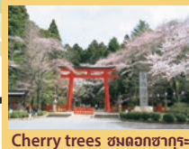
Cherry trees ชมดอกซากุระ