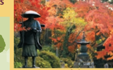
Autumn foliage ฤดูใบไม้ร่วง