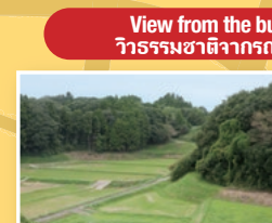
View from the bus วิวธรรมชาติจากรถบัส

Enjoy a nostalgic countryside landscape. On this JR Narita Line, the trains going in both directions share one railway track. บรรยากาศนั่งตามเส้นทางรถไฟ JR สายนาริยะ