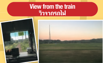
View from the train วิวจากรถไฟ

Enjoy a nostalgic countryside landscape. On this JR Narita Line, the trains going in both directions share one railway track. บรรยากาศนั่งตามเส้นทางรถไฟ JR สายนาริยะ