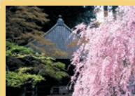
Cherry trees ชมดอกซากุระ

Duration of about 30 min. ให้บริการชม: 30 นาที