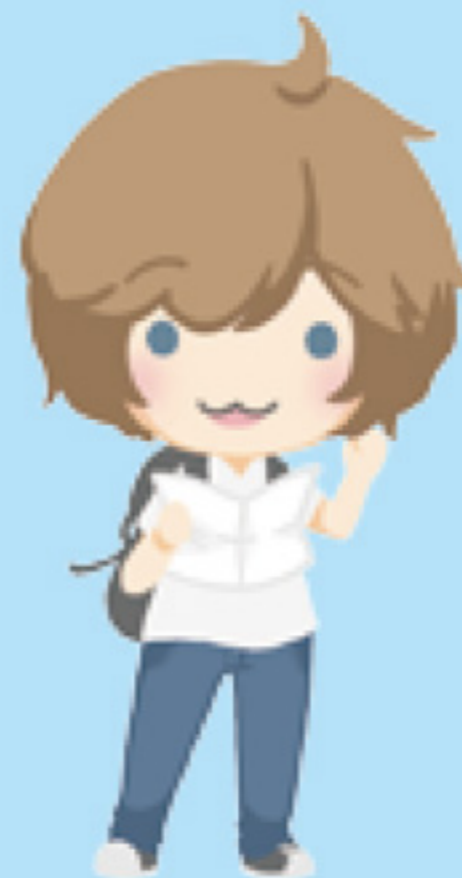
海外からのお客さま

欧米人は、日本人に比べておおらかな人が多く、動作も比較的大きな方が多いです。言葉の代わりに身振り手振りのボディランゲージでの意思疎通も考えられます。たとえば、指の本数で数を表したり、で伝えることもできます。