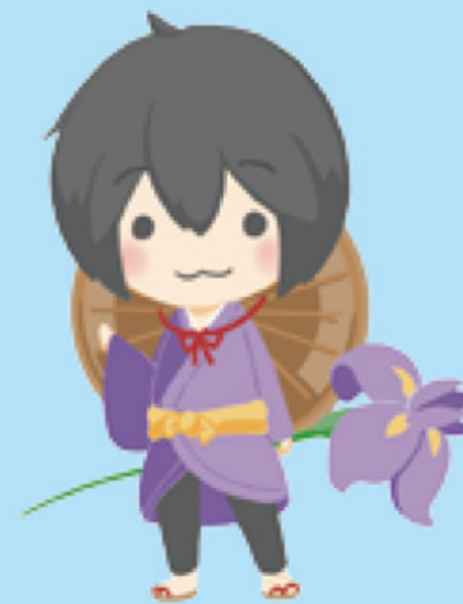
香取市外国人おもてなしBOOK 主人公 かとりあやめ