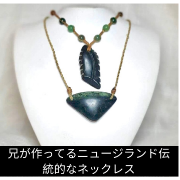
兄が作ってるニューージーランド伝統的なネックレス

ニューージーランド男性は様々なDIYも大好きです。家のリフォームや、庭仕事など、様々なDIYをやるので、そのツール・用品・ギフトカードなどをプレゼントするのが普通です。父の日の話じゃないけど、兄が趣味でネックレス作りするので、そのようなツールをよくプレゼントします。