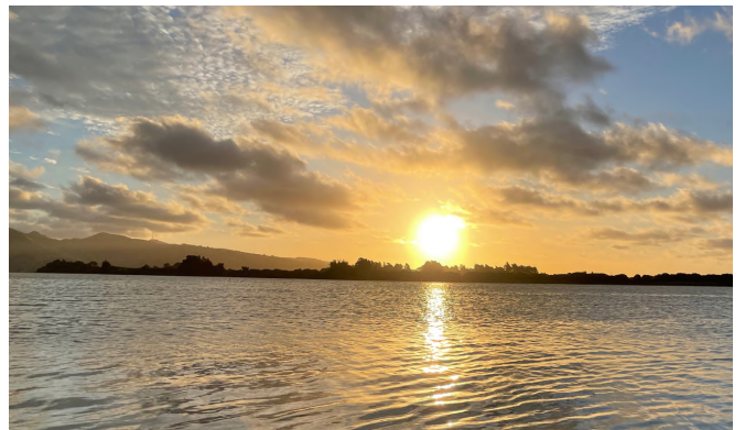
クライストチャーチの海

実はニュージーランドは季節が逆なので、真夏のクリスマス若くは若い頃から過ごしていました。映画で見ると、海外でも冬の映像が出るんですが、ニュージーランドは南半球なので、暑くて明るいクリスマスです。日本は若い人達が恋人と過ごすことが多いと思いますが、ニュージーランドでは毎年必ず家族と過ごします。