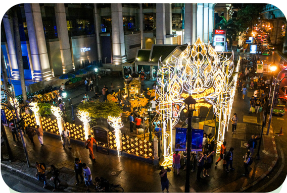
バンコクの有名なパワースポット「エラワン祠」もイルミネーションによってキラキラになっています

イルミネーションの他に、クリスマスにチキンを食べること、神社での大祓、家に門松や鏡餅を飾るなど、12月のうちにやるのがたくさん(大掃除は忘れましょう!)。その中には12月31日大晦日にそばを食べる習慣「年越しそば」もありますよね。