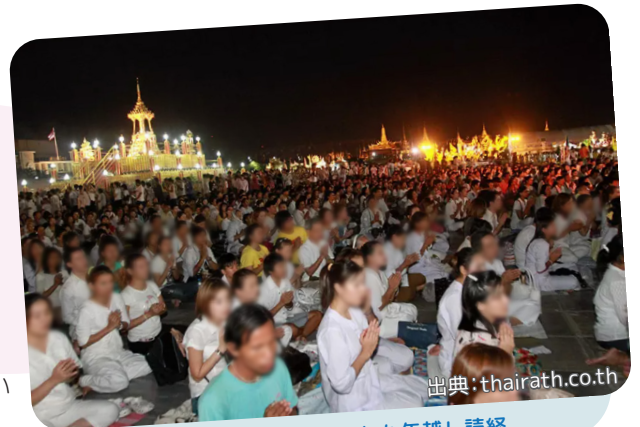
各地のお寺で開かれた年越し読経

タイでは大昔から仏教を信仰する人が多く、タイ人の生活にかなり身近な存在で、国民の祝日の中には仏教に関わる祝日もあります。大晦日にタイに行く機会があれば、タイにしかない「年越し読経」を体験してみてもいいのではないでしょうか。