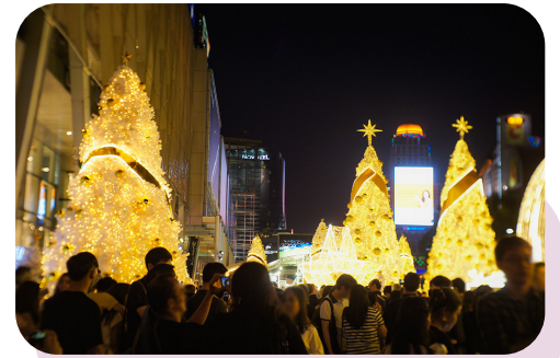
セントラルワールドデパート前のイルミはバンコクで一番有名な人気スポット