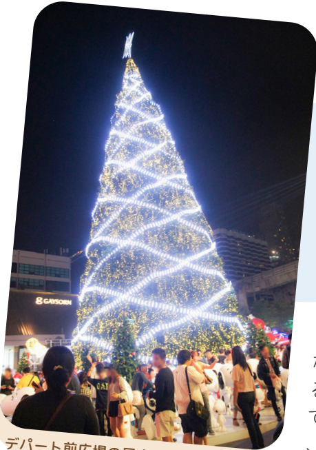
デパート前広場の巨大クリスマスツリー

まだタイに行ったことない方でも、タイは一年中暑く、夏しかないという冗談交じりのウワサ(事実です・・・)を耳にしたことがあるかと思います。山が多い北部では気温が一桁になる時期もありますが、私が住んでいる中部のバンコク辺りは一番寒い時期でも20℃くらいでした。そのおかげで、外の寒さで手が震えながら写真を撮ることもなく、半袖短パンで何時間でも撮り続けられます。