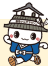
大会マスコットキャラクター かとまる