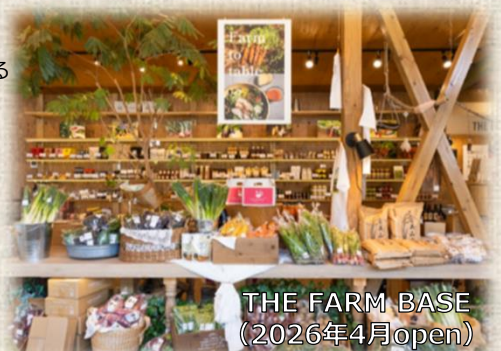
THE FARM BASE (2026年4月open)