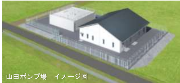
山田ポンプ場 イメージ図