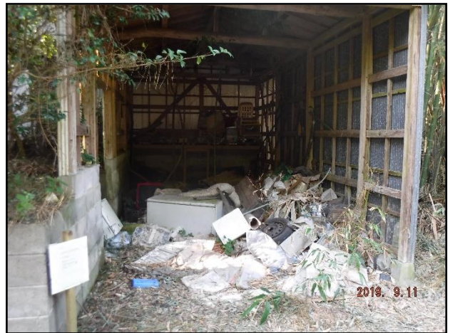
○車庫 (投棄されたゴミ)