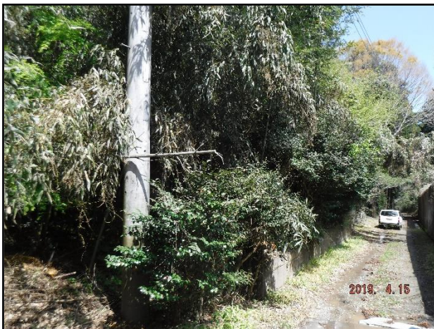
○道路に越境した樹枝