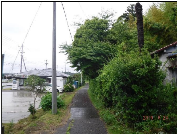
○道路に越境した樹枝