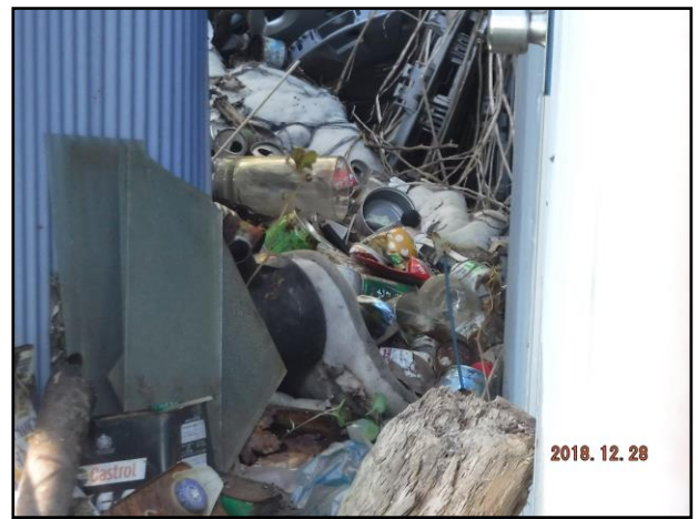
○散乱しているゴミ