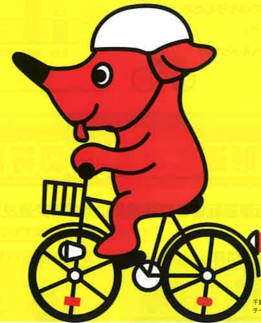
千葉県マスコットキャラクター チーパくん