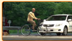
ダイジェスト篇 (約3分)