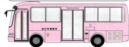
西ルート車両イメージ図

小見川総合病院 ~ 本多病院前 ~ 上小堀 ~ 織幡 ~ 油田入口 ~ 本多病院前 ~ 小見川総合病院 ~ 小見川駅 ~ 城山公園