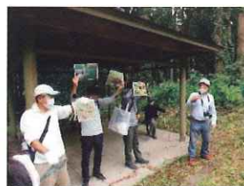
里山での注意点について説明をしている様子

今年は昨年ほど栗が拾えず、残念がる声も聞かれましたが、栗がなくても参加者同士で秋の味覚などを話題にしながらか散策を満喫していました。