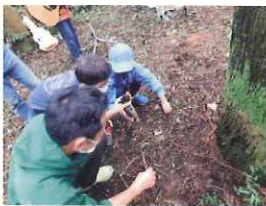
蛇を見つけて観察している子どもたち

参加者は草花の名前や虫等について説明を受けながら歩き進め、咲いている花を見つけると資料と照らし合わせて花の名前を確認する方も多く、改めて里山の草花に興味を持った様子でした。