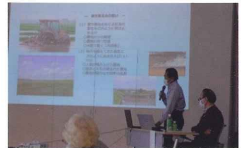
田会長の説明の様子

小見川地区の協議会の方もオブザーバーとして参加されていたのですが、違いはどこにあるのか気になりました。