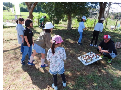
輪投げ うまくいったよ!

午後からは芋煮会です。「芋煮」は貝沢山、おなかいっぱいいただきました。3杯もお代りした強者もいました。