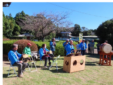
中峰芸座保存会による演奏