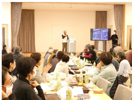
高齢者ふれあい集会