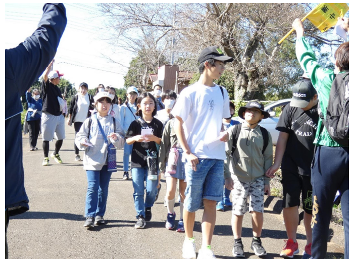
健康ウォーキング