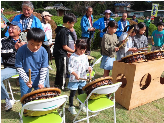
芋煮会での子どもたちの芸座体験

今後とも、地域コミュニティの活性化、地域課題の解決に向けて協議会活動を進めていきますので、皆様のご理解、ご協力をお願いいたします。