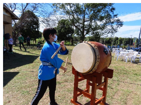
中峰芸座保存会による演奏