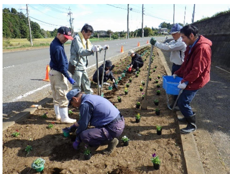
区の皆さんによりきれいに植え付けられました

今年も中峰区入り口の道路沿いの花壇に、パンジーと葉牡丹の植え付けを行いました。寒さの中、きれいに咲いていますので、皆さん鑑賞してください。