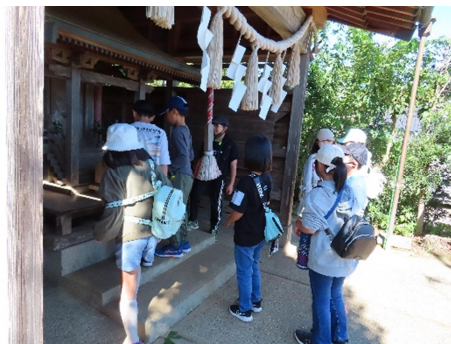
中峰稲荷神社で休憩・お参り