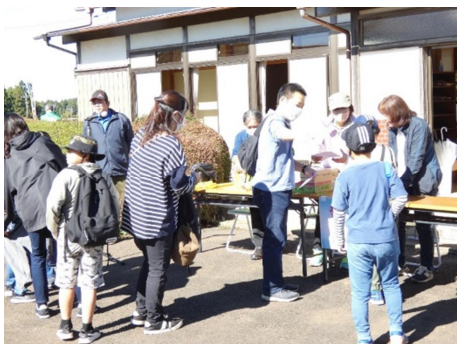
受付して さあウォーキング出発

午前健康ウォーキングが開催され、参加者33名が区民センターを出発し、畑、田んぼ、山林の道(概ね3.3km)を散策しました。途中、稲荷神社で休憩し、約1時間の行程を歩き切りました。区民センターに到着後、輪投げ、グラウンドゴルフを活発に行い、おなかもぺこぺこになりました。