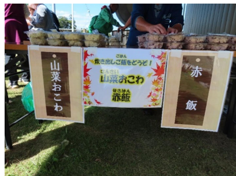
災害時に必要な非常食も試食しました