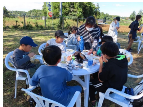
美味しいね いっぱい食べたよ!