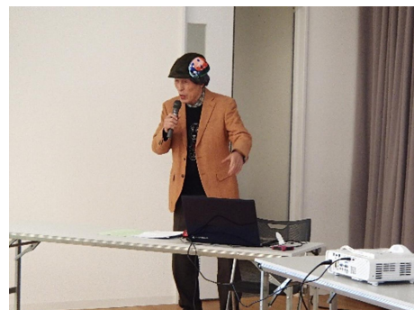
外口先生のお話分会场爆笑です