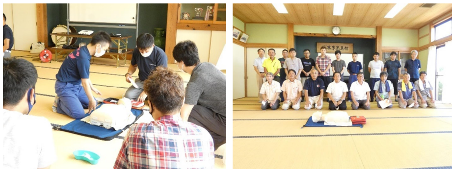
胸骨圧迫訓練と AED操作訓練

3地区住民自治協議会合同の防災体験学習が、東京消防庁本所防災館で開催されました。参加した8家族19名の皆さんは地震、大雨や火災時の煙などの体験と災害発生時の対応について学びました。