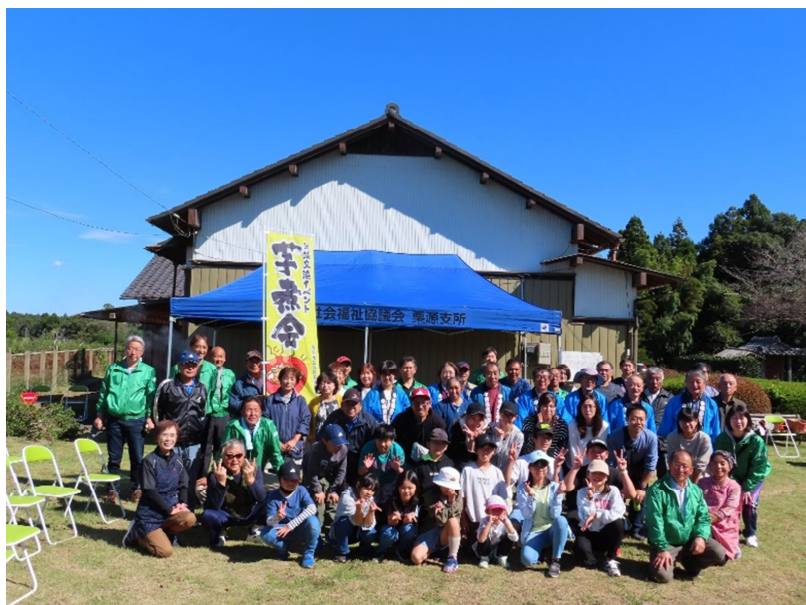
快晴に恵まれ無事できました

午後からは芋煮会です。「芋煮」は貝沢山、おなかいっぱいいただきました。3杯もお代りした強者もいました。