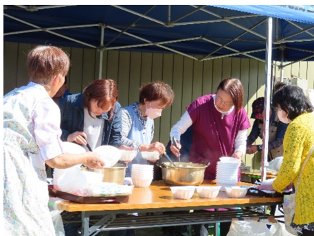
芋煮の盛付けも順調です