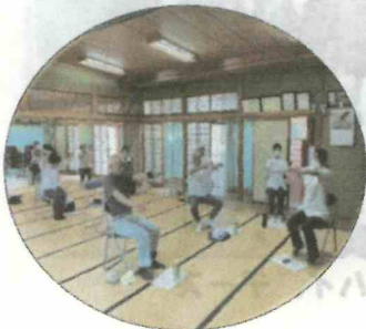
大きな声でイチニッサン