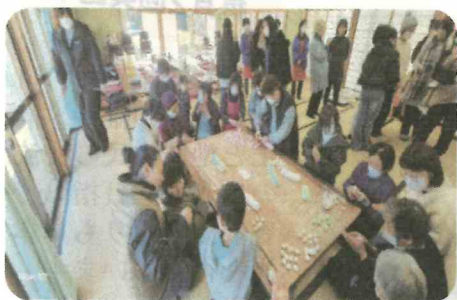
みんなでワイワイだんごづくり