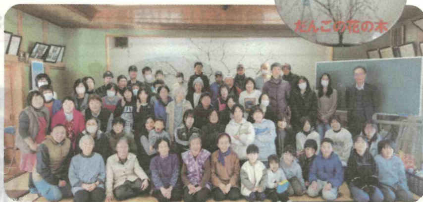
だんごの花を味かせた木の前でハイ、チーズ