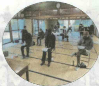
脳トシで頭も柔らかく?!