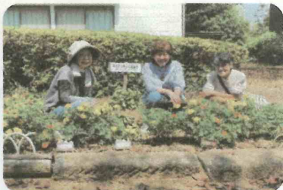
沢区民センターの花壇もきれいになりました