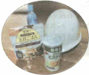
災害に備えた平素の準備

千葉県西部防災センターで、風速30mの威力や火災発生時の煙からの避難、消火器の使用方法などを体験し、いざという時に自分の身を守るためにどうすればよいかなどについて学びました。