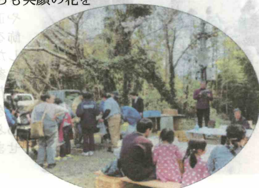
駐在さんの防犯講話