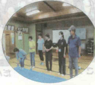
ポッチャに初挑戦

令和6年から、自身の健康の維持、向上と地域住民の交流の広がりを目指して香取健康もりもり体操を行っています。簡単な体操で、どなたでも参加できます。タオル一本持参でぜひお越しください。