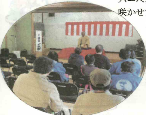
落語研究会「縁」による古典落語

3月29日、満開の桜が開いた沢区民センターでお花見会を開催しました。落語やお楽しみプレゼント、お肉いっぱいのバーベキューなど集まった人たちも笑顔の花を咲かせて春を満喫しました。