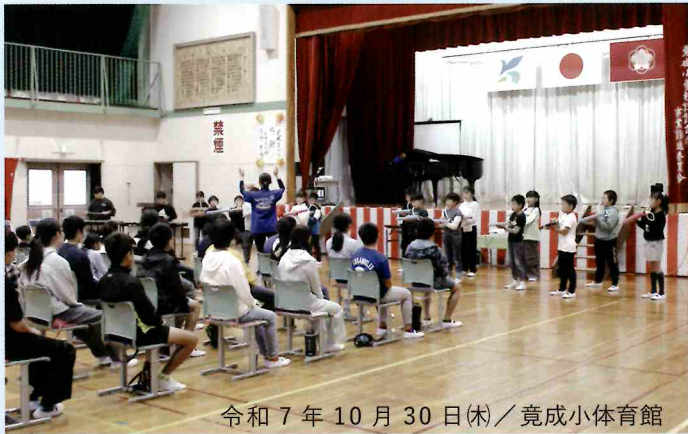
令和7年10月30日(木)／竟成小体育館

竟成小学校の児童や地域内外・老若男女誰でも参加できるイベントを開催し、地域の魅力や雰囲気伝え、関係人口の増加を目指し、地元の歴史や文化にふれてもらい、郷土愛やふるさとへの誇りを育む。