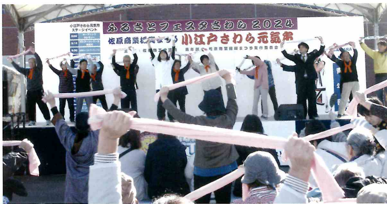
ふるさとフェスタさわら

日本は今までにない高齢社会を迎えています。寝たきりや認知症などによる介護の問題が大きな課題となっています。昔なじみの音楽（童謡）に合わせて運動を行うことで、楽しく健康体操ができます。