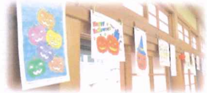
ハロウィン用にみんなで色を塗り飾りました。 自分のわかるかな?