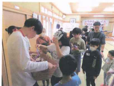
「トリック・オア・トリート!」