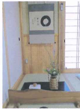
茶道体験会場「いち♡プレ庵」本物の茶室っばい！