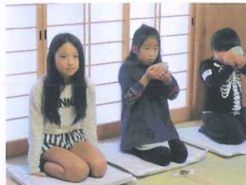
お茶の飲み方、上手～