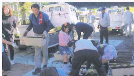
好きな色を選んで、手際よく植えています。