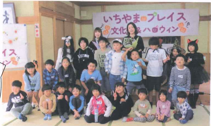
素晴らしい演奏、ありがとうございました。