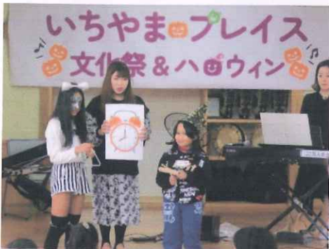
うまくできるかな…楽器に挑戦!