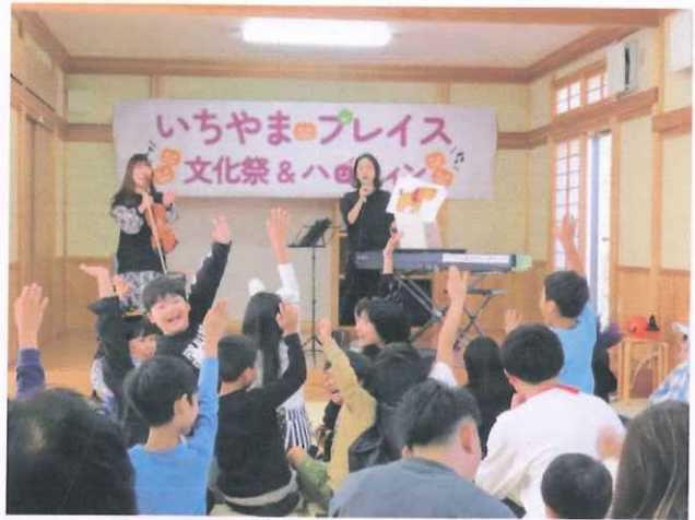
クイズ、みんなわかったみたい。