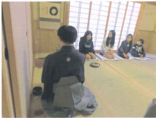
お点前、難しそうね…