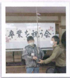
記念樹を受け取る卒業生