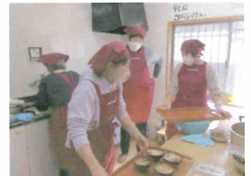
健康推進委員の皆さん