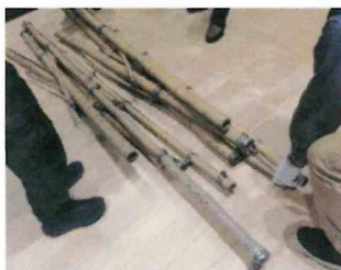
竹製の柱や梁の材料

その後、「まち協事業の今後 の可能性について」をテーマに グループ討議を行い、他の協議 会の取組みを知る貴重な機会 となりました。