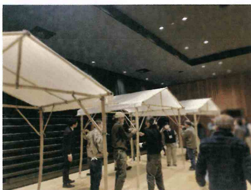
短時間で竹テントの組み立てが完了