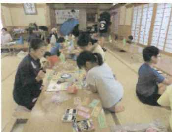
子どもたちと遊ぶ