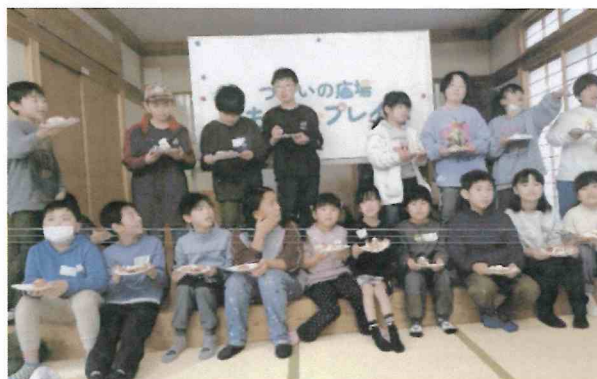
ガンバって上手にできました

この日は受験を終えたばかりの中学生3人が子どもたちと一緒に遊んでくれました。受験の緊張感から解放され、サッカーや鬼ごっこに興じる姿は、とても清々しく、見ていて温かい気持ちになりました。