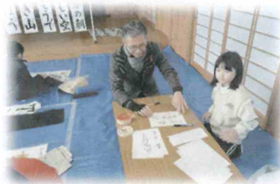
フェルトペンで書く「元気な子」