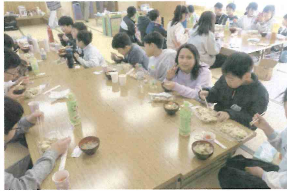
みんなで美味しく食べました