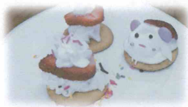
かわいくデコレーション!

午後は暖かな日差しに誘われて、外の 境内には多くの子どもたちの姿が見られ ました。室内でゆっくり過ごすす子もいれ ば、外で思いきり体を動かす子もいます。 「いちやま・プレイス」は、自由に過ごせ る場所、それぞれが「好き」を大切に時間 を楽しんでいます。