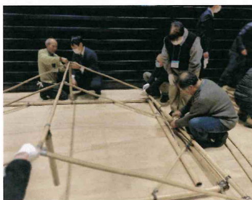
テントの大きさ幅、高さ、奥行き、2.6m