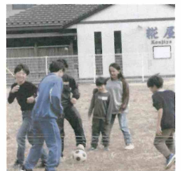
中学生に負けられない!