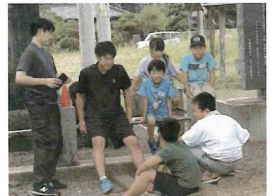
大学生は子どもたちの人気者

「いちやま・プレイス」の活動は、地域の皆さまの支えによって成り立っています。いつも関わってくださっているボランティアの皆さま、ご協力ありがとうございます!