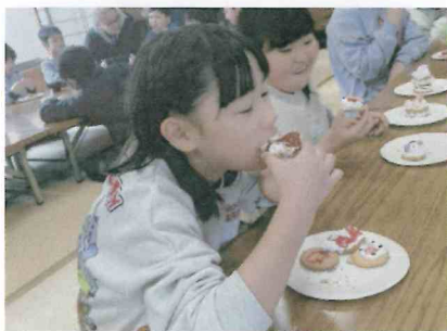
食べるのがもったいな〜い

この日は受験を終えたばかりの中学生3人が子どもたちと一緒に遊んでくれました。受験の緊張感から解放され、サッカーや鬼ごっこに興じる姿は、とても清々しく、見ていて温かい気持ちになりました。