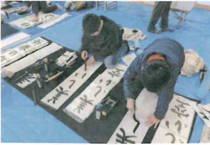
真剣に筆を走らせる

午後からは外遊び。前日の残った雪 で雪だるまを作ったり、雪投げをした り、ぼかぼか陽気の中で冬ならではの 遊びを楽しみました。 真剣な表情と弾ける笑顔、どちらもキ ラキラと輝く最高の一年のスタート となりました。