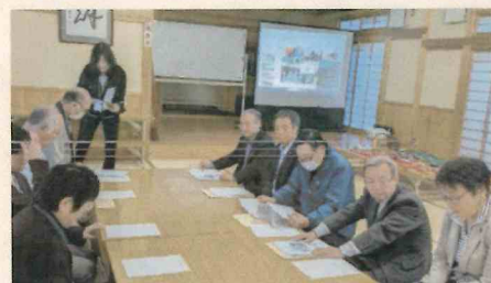
11月の「いち・プレ」での取材の様子