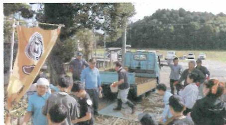
ふるさと保全会の皆さんと一緒に