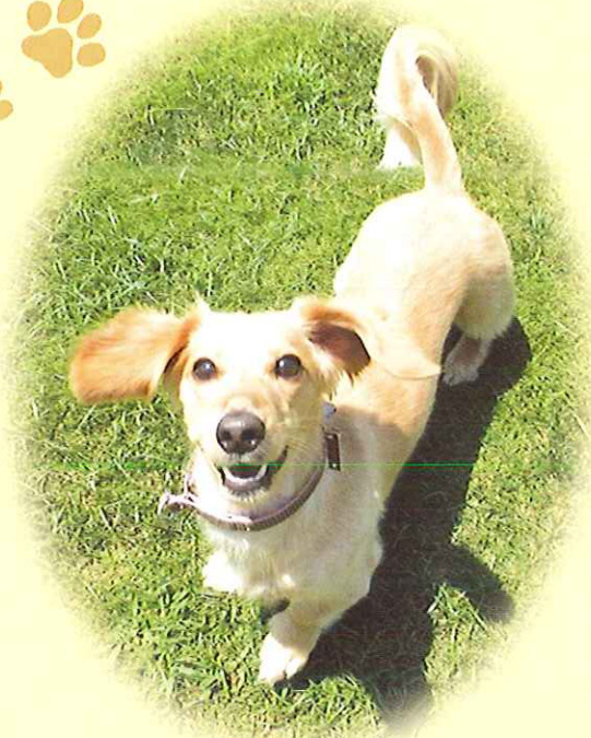
いすみ市 きなちゃん