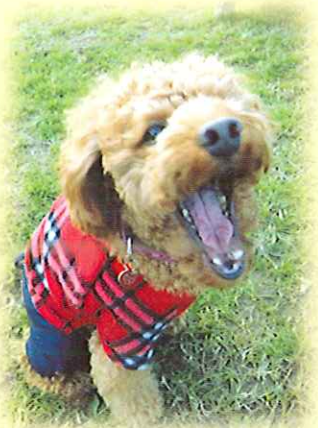
市原市 アメリカちゃん