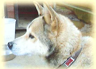
銚子市 サブロウくん