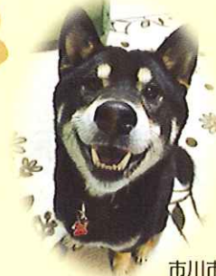
市川市 シンバくん