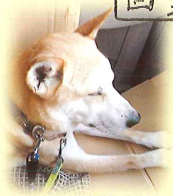
四街道市 ベベくん