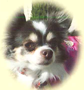
千葉市 チョコちゃん