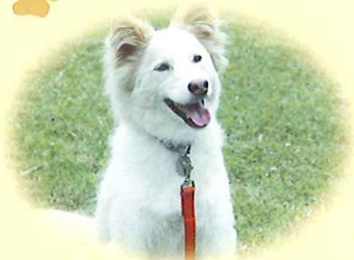
富里市 こはるくん