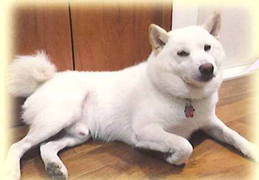
市川市 モンテくん