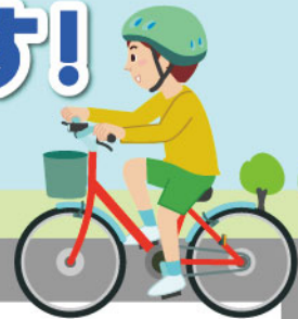
自転車乗中死者損傷部位 (令和2年~令和6年)