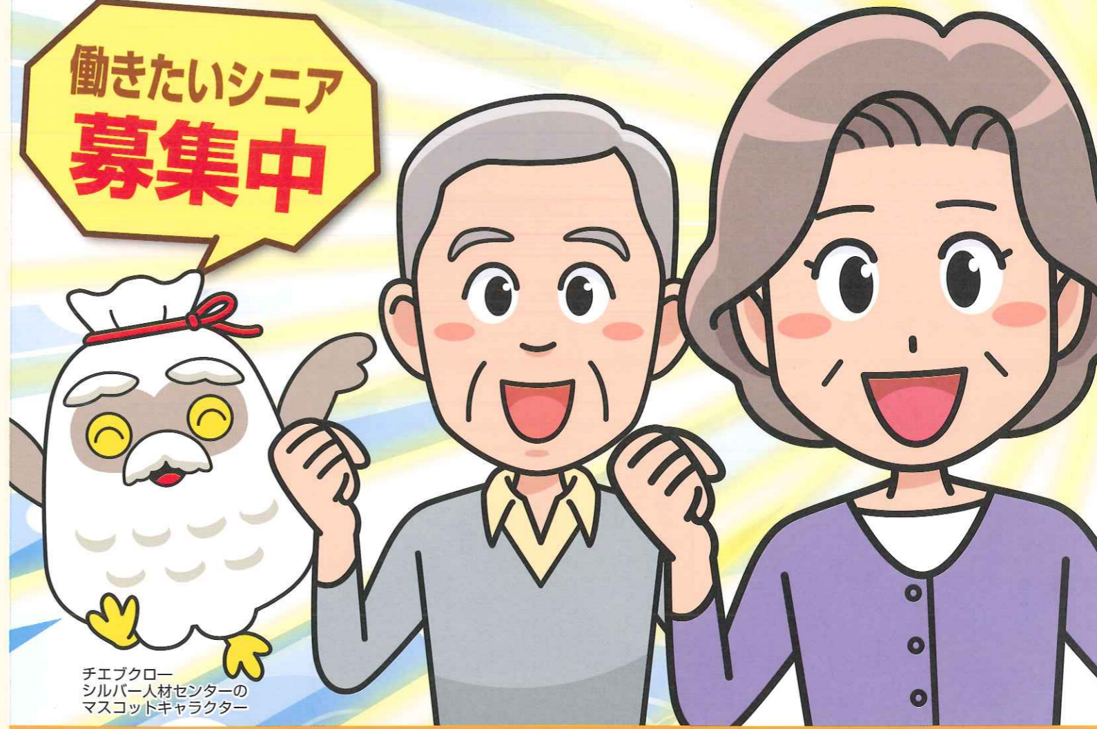
チエブクロー シルバー人材センターの マスコットキャラクター

公益社団法人 千葉県シルバー人材センター連合会 〒260-0013 千葉県千葉市中央区中央 3-9-16 大樹生命千葉中央ビル 4階 TEL:043-227-5112 千葉県シルバー人材センター連合会は、「高齢者等の雇用の安定等に関する法律」に基づいて事業を行う、千葉県知事の指定を受けた公益法人です。千葉県内48市町村にあるシルバー人材センター等の活動支援や、労働者派遣事業、就業体験・技能講習の開催、シニアの社会参加を促進するための啓発活動(このリーフレット制作もその一環です。)などを行っています。