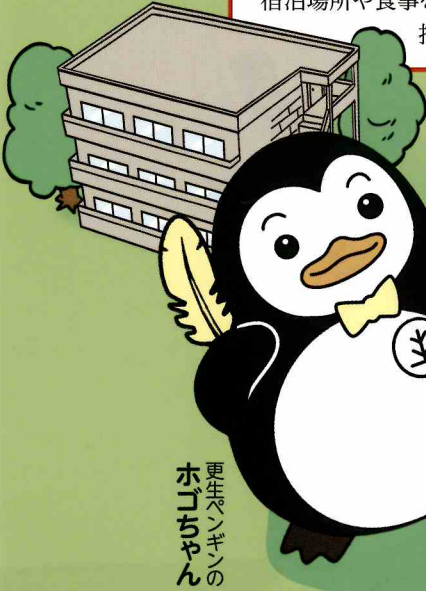
更生ペンギンの ホゴちゃん

刑務所等を出た後、帰る場所がない人たちに宿泊場所や食事を提供し、自立に向けた生活指導を行う民間の施設です。