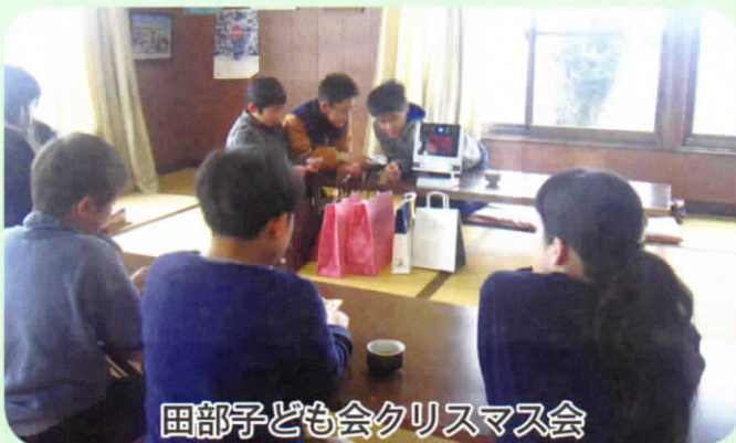
田部子ども会クリスマス会