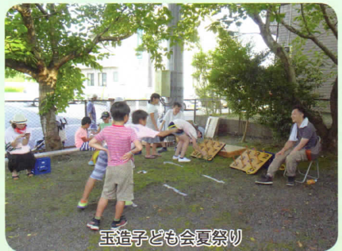
玉造子ども会夏祭り