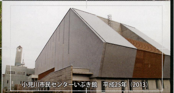
小見川市民センターいぶき館 平成25年(2013)