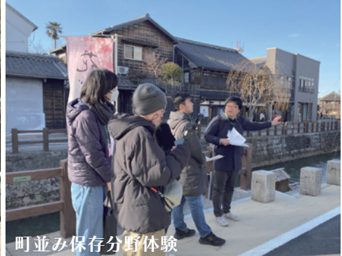
町並み保存分野体験