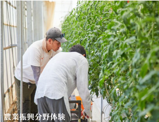
農業振興分野体験