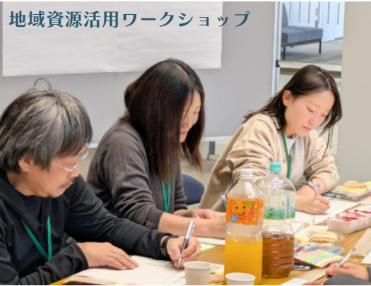
地域資源活用ワークショップ