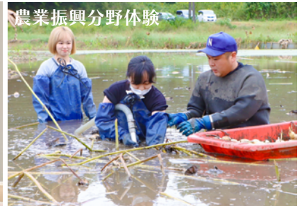
農業振興分野体験