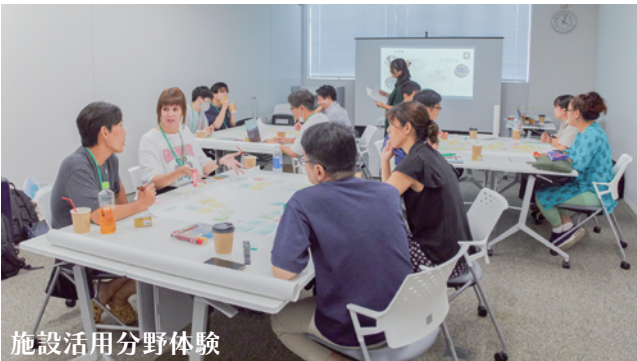
施設活用分野体験