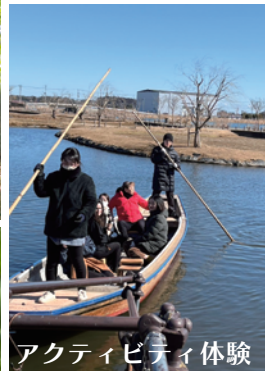
アクティビティ体験