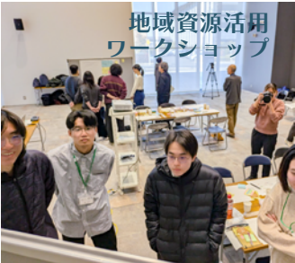
地域資源活用 ワークショップ