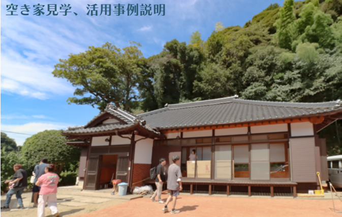
空き家見学、活用事例説明