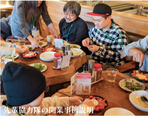
先輩協力隊の開業事例説明