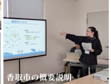
香取市の概要説明