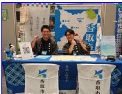
移住相談会への参加