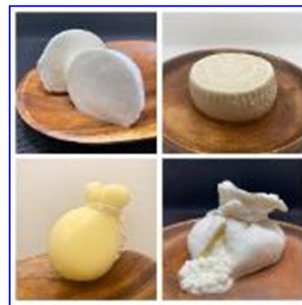
地域産品を使った飲食店での研修やビールやチーズの製造、広報事業等