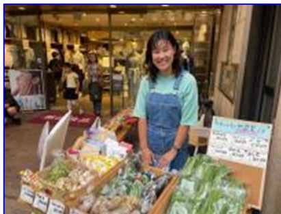
香取市産食材のマルシェ