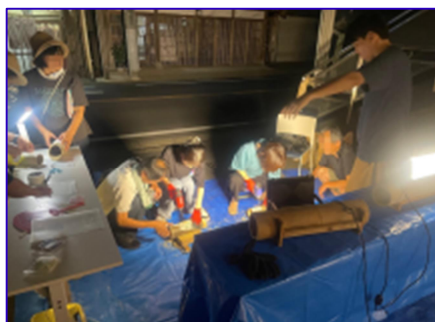
関係人口イベント等の企画運営