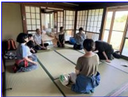
地域イベントの実施