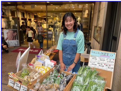
香取市産食材のマルシェ