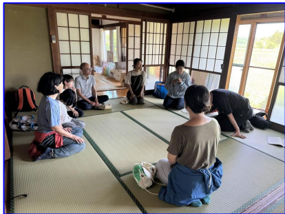
地域イベントの実施