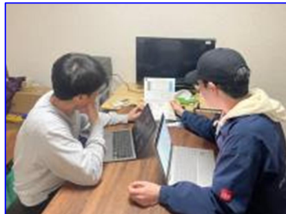
複数隊員での地域商社の立上げ