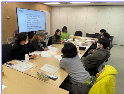
「PR チーム」での会議・企画の実施