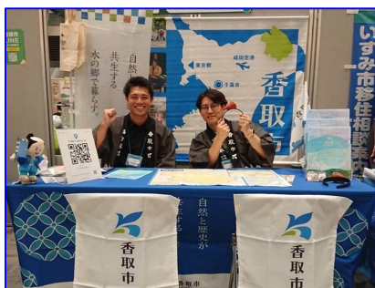
移住相談会への参加