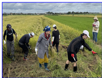
関係人口イベント等の企画運営