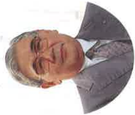
水郷駅周辺整備推進協議会長