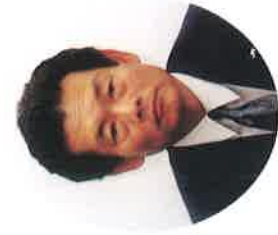
東日本旅客鉄道株式会社