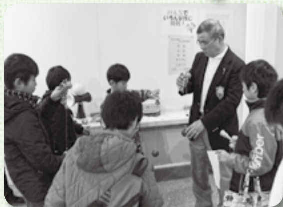
▲今も昔もけん玉は難しい!

また、市民ギャラリーではけん玉やコマ回し、小物作りやナンプレなど、人材バンク事業登録ボランティアの皆さんが企画した体験フェアも同時開催。訪れた子どもたちだけでなく、大人も童心に帰って頭を使ったり手を使ったり、いろいろなアトラクションを楽しんでいました。