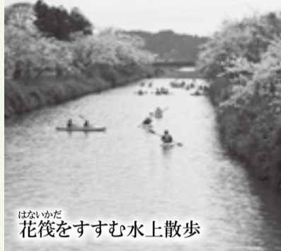
花筏をすすむ水上散歩