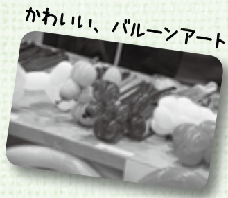
かわいい、バルーンアート