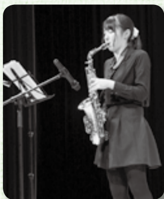
▲しなやかな音色が会場に響く