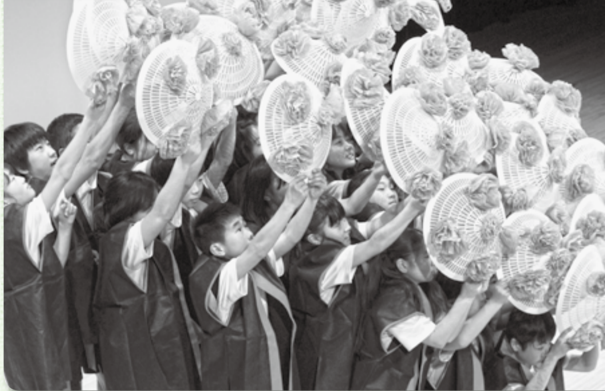
▲栗源小学校児童の美しい花笠音頭