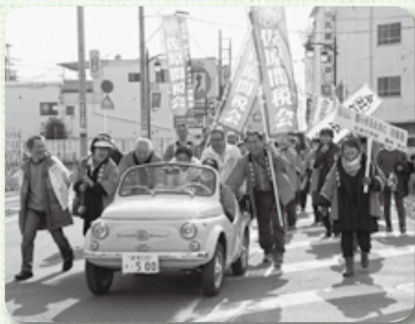
▲クラシックカーとともに笑顔で行進する協議会メンバー

チラシや配布物を市民や観光客に配り、確定申告をPR。パレードには、千葉敬愛高校のマーチングバンド、カトレンジャー、クラシックカーやカスタムカーも参加し、パレードに花を添えていました。