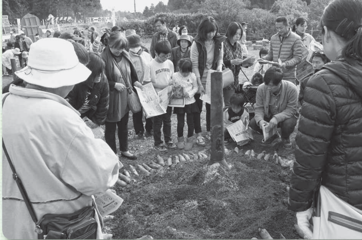
▲どのおいもにしようかな？（栗源：日本一の焼いも広場）