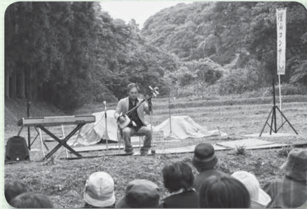
▲力強い三味線の音色で観客を魅了

ステージは、背景に杉並木や秋色に染まりつつある雑木林、そして眼前には広がる谷津田と、まさに自然の音響空間。マジックショー、カラオケも開催され、参加者は解放感あふれるコンサートを楽しんでいました。