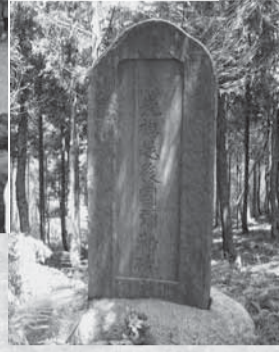
▲ささら舞の起源が記された弥勒碑

市の西部、玉造の住宅地を臨む台地の奥に、ひっそりとたたずむ石碑があります。この石碑は昭和12年の4月に地区の人たちによって建立されたもので、正面には「笹原舞先祖越後国弥勒碑」と刻まれており、背面には昭和53年まで、この地に伝承されていた「ささら舞」についての起源が記されています。その内容は「神話の昔、香取の祭神である経津主命が豊葦原中津国を平定する際、陣中で踊らせたものが伝わったという。詳細を記した文書は嘉永年中に火災にあい焼失してしまった。言い伝えでは土御門天皇の時代（鎌倉時代）に香取神宮の神幸祭に供奉していたが、やがて時代とともに衰退し、徳川の時代になって、越後の国の弥彦神社の神主弥勒という人が来て調子を整えた。その弥勒塚と伝えるこの跡に石碑を建ててお祀りする」というものです。