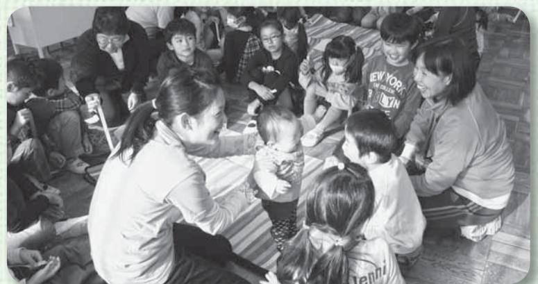
▲赤ちゃんに触れ合い笑顔がこぼれる