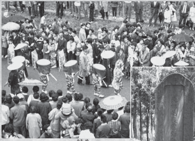
▲ささら舞の道行き