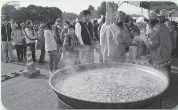
▲栗源産野菜たっぷりの豚汁を求め（栗源）