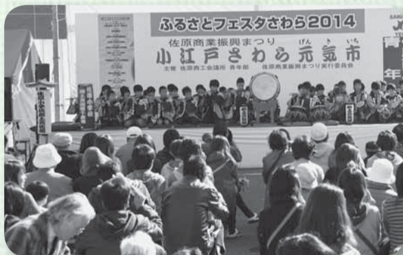
▲佐原小学校郷土芸能部による佐原囃子の演奏（佐原）