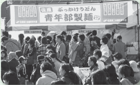
▲地元食材をふんだんに使った「さわらぶっかけうどん」（佐原）