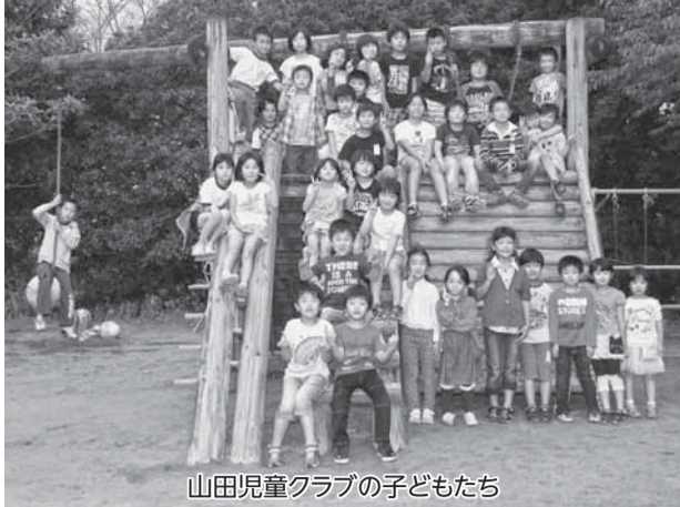
山田児童クラブの子どもたち