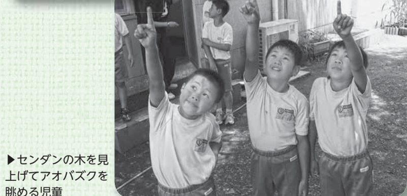
▶センダンの木を見上げてアオバズクを眺める児童

子どもたちは「小さいのはかわいくて、大きいのはかっこいい」と夏の訪れを告げるマスコットの飛来に目を細めていました。