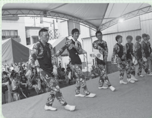
▲各町の手踊りをステージ上でも披露(仲町)

中日である19日には6町の屋台が総出。お囃子の音色が響き渡る中、勇壮に引き廻されました。また、おまつり広場に設けられたステージでは各町手踊りのほか、よさこいやフラダンスなども披露。中には遠く埼玉県からの出場者もいて、会場は大いに盛り上がりました。夜には雷雨となったものの、大根塚と八日市場の神輿が祇園祭に合流。人々の威勢のいい掛け声は晴天時にも増して熱気を帯びていました。