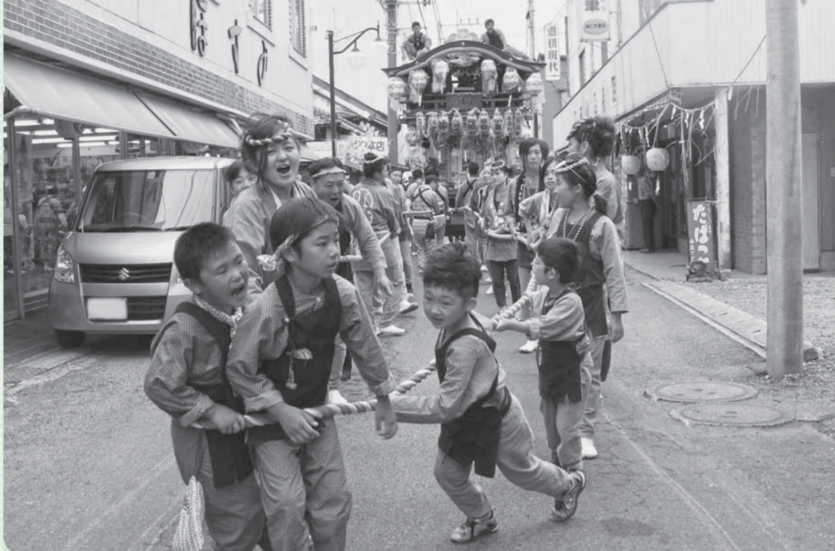
▲子どもたちが先頭になって元気に屋台を引き廻す(年番町の小路)