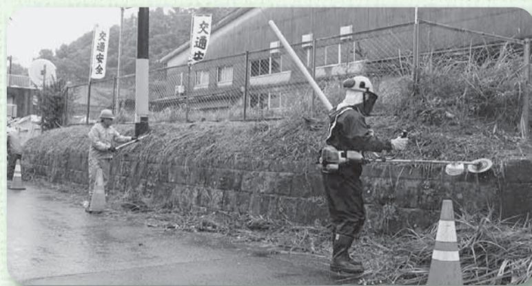
▲生い茂った草を刈り取る(旧佐原給食センター付近)

県建設業協会香取支部青年部による環境美化活動が、7月4日に市内各所で行われました。