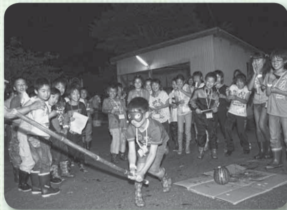
▲もっと左？なかなか当たらないスイカ割り

今回のわんぱく教室は、今では市内でもなかなか見る機会の少ない「ホタル」の観察で、子どもたちの中には初めてホタルを見ようという児童も。田んぼの中に光るホタルをみつけると「いた！光ってる！いっぱいいる！」と思わず感激の声。ホタル観察の前には「スイカ割り」、観察後には「かき氷」と、見て食べて大満足の日となりました。