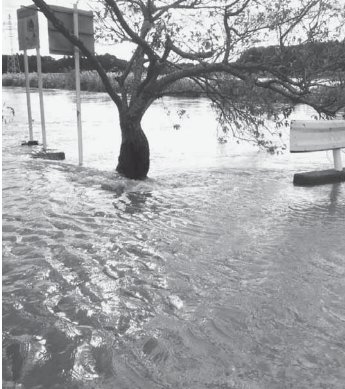
▲昨年10月の台風26号ではらんした大須賀川

台風や低気圧、前線などがもたらす暴風雨により、毎年、風水害や土砂災害が発生しています。近年は記録的な豪雨が以前よりも頻りに観測され、全国各地で大きな被害が発生しています。もう一度災害に対する備えを確認しましょう。