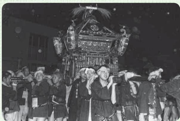
▲▶雨が降る中、力強く神輿渡御が執り行われ、担ぎ手の迫力は見ている人を引きつけました(写真上、大根塚/写真右、八日市場)