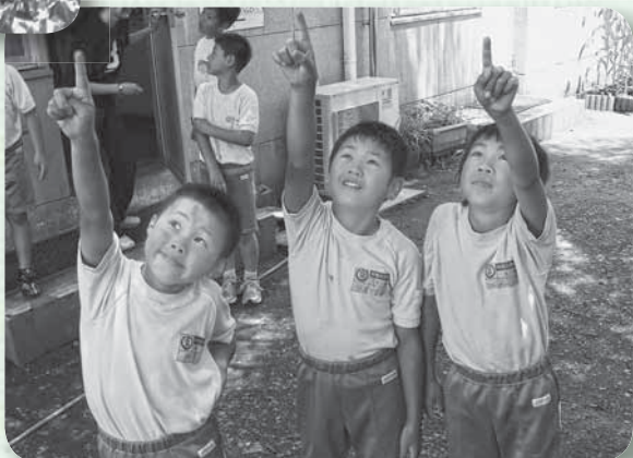
▶センダンの木を見上げてアオバズクを眺める児童

子どもたちは「小さいのはかわいくて、大きいのはかっこいい」と夏の訪れを告げるマスコットの飛来に目を細めていました。