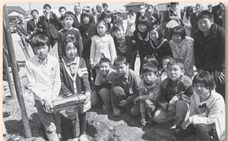
▲タイムカプセルにはさまざまなメッセージが込められました

本校との統合により、107年の歴史に幕を下ろすこととなった、小見川北小学校利北分校で、児童、地域住民などが参加しての閉校式典が3月23日に執り行われました。