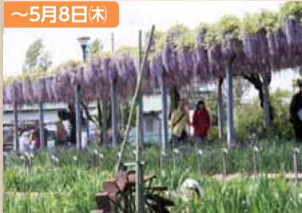
観藤会(水郷佐原水生植物園)