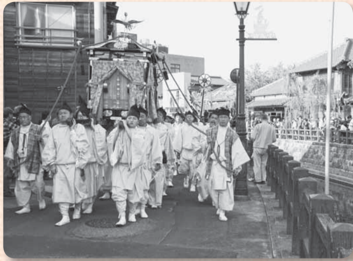
▲小野川沿いを進む御神輿