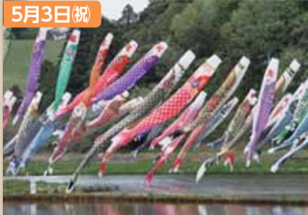
いきいき山田鯉のぼりまつり