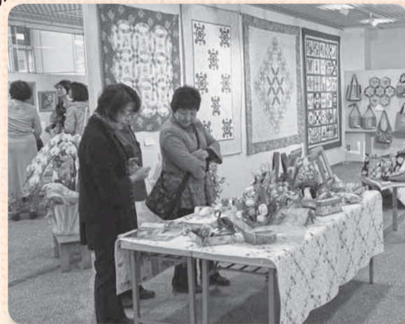
▲見ても楽しめる力作がそろそろ

また、会場にはパッチワークの体験コーナーもあり、多くの子どもたちが体験。作る楽しさを感じることができました。