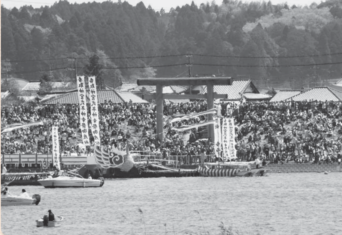
▲御座船を見ようとたくさんの方が訪れました（津宮鳥居河岸）