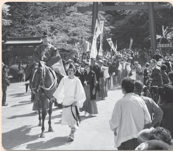
▲津宮鳥居河岸を目指して香取神宮を出発