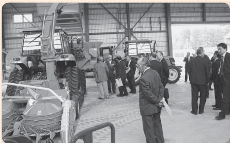
▲センター内は、大型の機械が並ぶ

この施設は市内の酪農家5人が「ファームサポート かくほん かとり(株)」を立ち上げ、整備しました。施設内には大型の攪拌機や梱包機、収穫機などが備えられ、1日当たり約400頭分の餌（18トン）の生産を見込んでいます。これにより、各酪農家の飼料をつくる手間が省け、生産の効率化が期待されます。