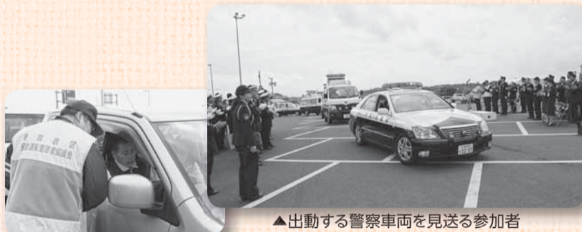
▲安全運転を呼びかけました

また、式終了後には「安全運転をお願いします」と交通安全協会指導員らがドライバーに啓発活動を行いました。