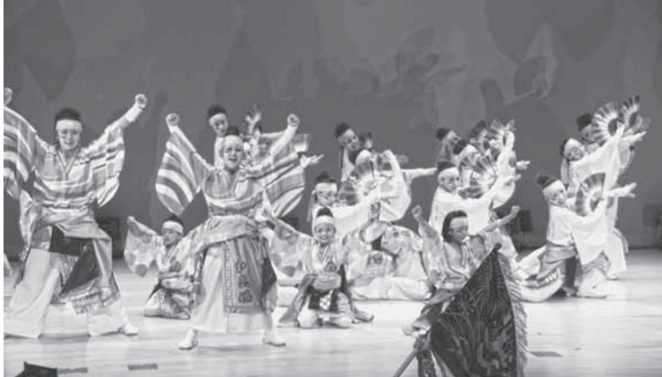
▲平成25年度地域振興事業 「待ってたよ!いぶき館 ゆかいな仲間たちのワンナイトカーニバル」

市では、地域課題の解決に向けた取り組みや、地域を元気にしていくための取り組みなど、地域の特色を生かしたまちづくりに取り組む事業に対し、助成を行います。 この地域振興事業の実施団体を募集します。詳細は募集要項をご覧ください。