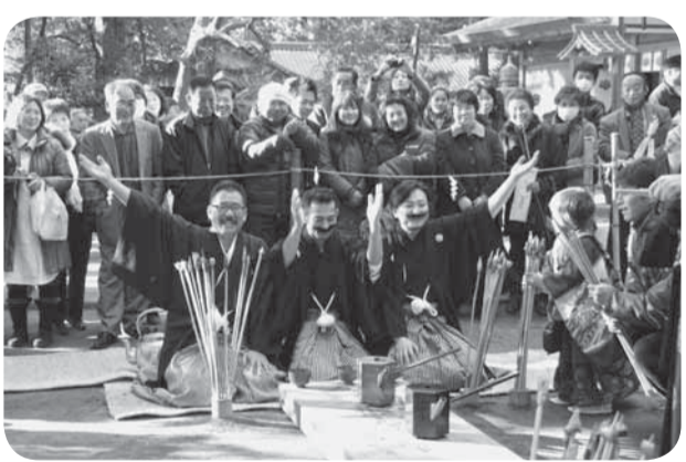
▲ひげをたくわえた紋付き袴姿の氏子

鎌倉時代から約800年続く「ひげなで祭」が側高神社（大倉）で行われました。この祭礼では、社殿前に用意された舞台上、新旧当番の氏子が対座してお酒を酌み交わしながら、当番を引き継ぐ行事が行われます。前年の当番がひげをなで、新当番にお酒を勧めることから「ひげなで祭」と呼ばれるようになりました。見物客からは「もう一杯」などの掛け声もあがり、紋付き袴姿の氏子がひげをなでるたび歓声が上がりました。