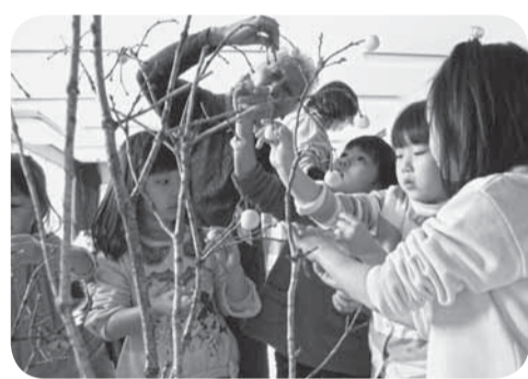
▲上手につけて、きれいな花が咲きました

だんごならしは豊作の願いを込めて行われる行事。保育所のみんなが1年間楽しく、元気に保育所生活が送れるようにと願いを込めて行われました。