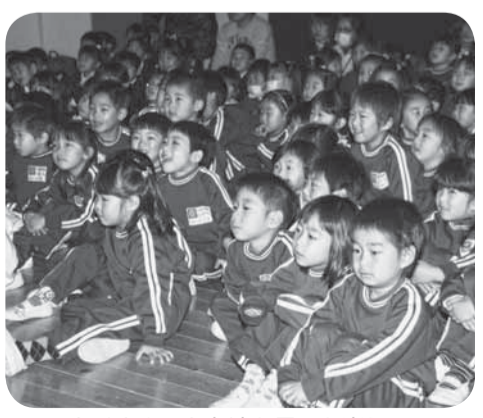
▲たくさんのお友達と見ると楽しい！

市内の公立幼稚園の園児たちが一同に集まるイベントは、この日が初めて。園児たちは、劇団すぎのこによる人形劇「わらしべ長者」を鑑賞して楽しみました。