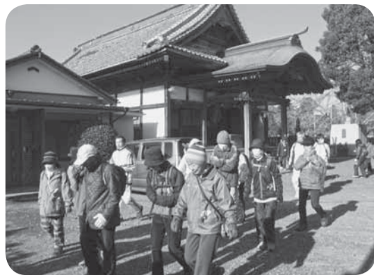
▲市内各所の寺社を巡り1年の健康を祈願

天候に恵まれ、空気がすがすがしい自然豊かな山道でのウォーキングに、参加者同士の会話も弾みました。