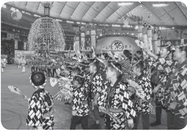
▲のの字廻しを囲んではやし立てる東関戸区の皆さん

日本最大級のふるさとの祭典「ふるさと祭り東京」が東京ドームで開催。全国各地から集まった伝統あるお祭りや名物グルメで会場はにぎわいました。1月10日から12日までの3日間、佐原の大祭から東関戸区の山車がステージに登場。いつものお祭りとは一味違うのの字廻しや踊りのステージ演技に、観衆からは大きな拍手が送られました。