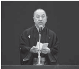
▲成人式でのあいさつ