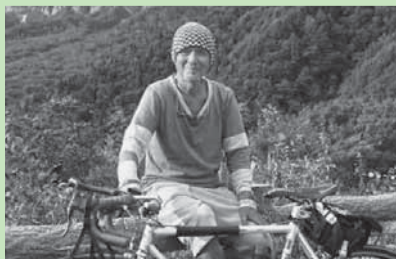
▲火野正平さん

🌐http://www.nhk.or.jp/kokorotabi/ ☎03(3465)1327 ☎NHKふれあいセンター ☎0570(066)066 ☎050(3786)5000