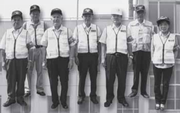
市内金融機関をパトロールし、振り込め詐欺防止を呼び掛けているK・Kパトロールの皆さん