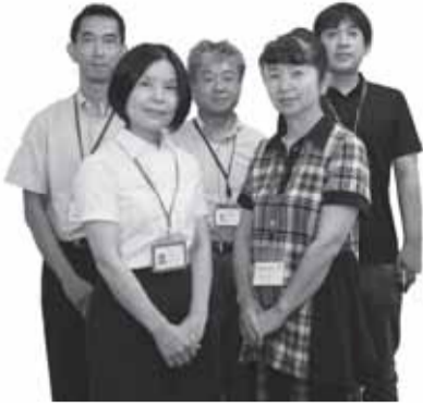
消費生活センターの皆さん

消 費生活センターでは、専門の相談員が消費生活に関わるさまざまな相談を受けています。問題解決に向けて情報提供や助言を行い、個人で問題が解決できない場合は相談員が事業者と相談者の間に入り、解決に向けて話し合いをします。