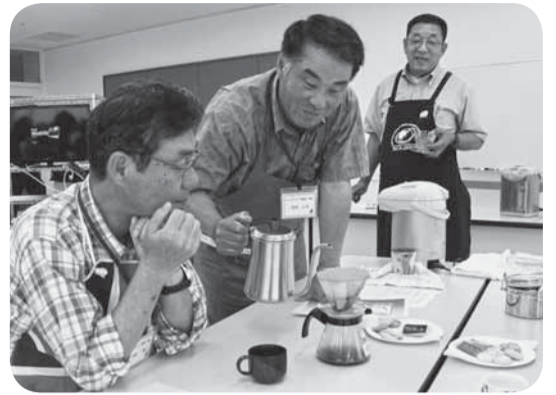
▲いい香りが漂ってきました

プロからうまいコーヒーの入れ方を学ぶ、メンズライフ講座「極」が小見川市民センター「いぶき館」で行われました。