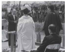
▲あやめ祭り嫁入り舟