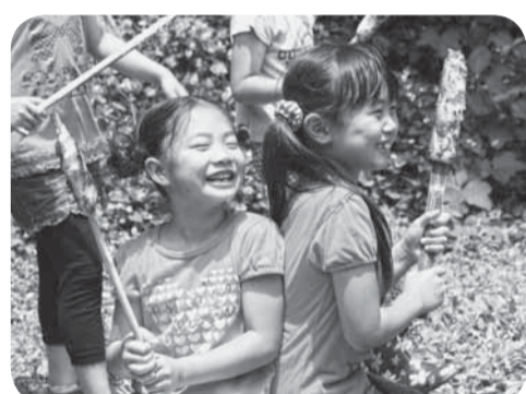
▲五平餅を笑顔でほおばり、自然を満喫

梅雨の晴れ間、山田児童館による「県民の日遊び体験」が山人の森（新里）で行われ、子どもたちは「ボランティア集団山人」の皆さんと里山を散策しました。