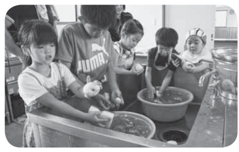
▲泥の付いたジャガイモを丁寧に洗います