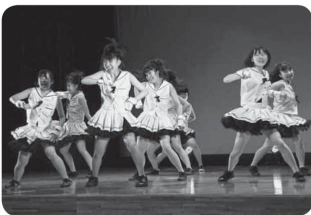
▲軽快なステップを披露（佐原高校ダンス同好会）

県民の日を記念して、今年のテーマを「ダンス」とした「県民の日かとり」が、東庄町公民館で開催されました。 香取郡市内の団体が集まり、ダンス、神楽、吹奏楽の演奏を披露しました。香取市内からは佐原高校ダンス同好会、千葉晴陽高校ダンス部、オミザイル、牧野神楽保存会、小見川中学校吹奏楽部が出演。フレッシュで息の合ったダンスは観客を魅了しました。