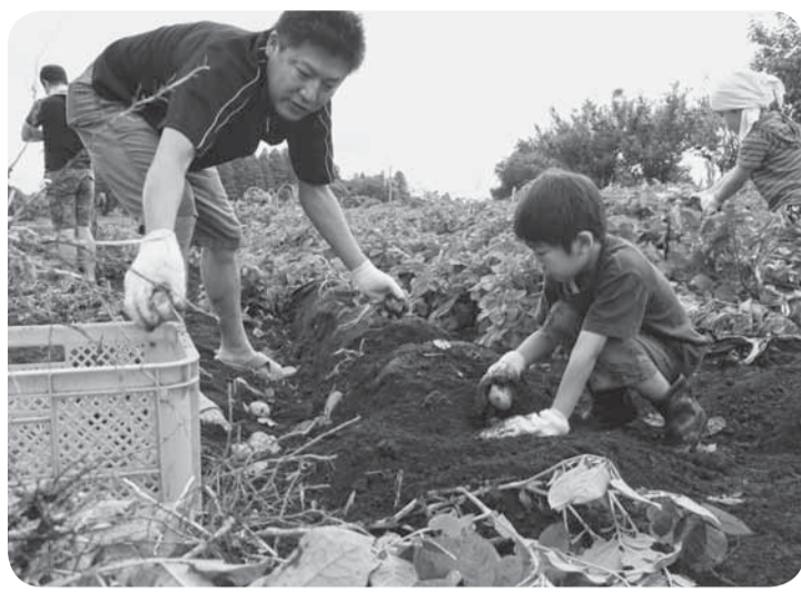
▲土の中にある大量の新じゃがの収穫に熱中