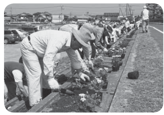
▲四季の花壇にそろって植え付け、花いっぱいになる。約3,000株のマリーゴールドが道行く人の目を楽しませてくれています。

当日は天候も良く、汗ばむほどの陽気の中「黒部川をふるさとの川にする会」の皆さんをはじめ、多くの市民がボランティアで参加し