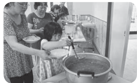
▲気持ちのこもった手作りカレーを器に盛り付け

6月15日の県民の日に合わせ「新じゃがを掘ってカレーを作ろう」が、道の駅くりもとで開催されました。