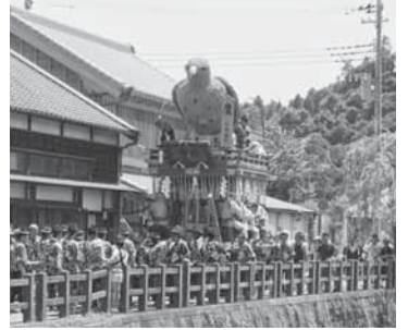
仁井宿(鷹) 稲わらで作られた鷹。