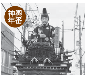
下仲町(菅原道真) 梅を愛でる菅原道真。