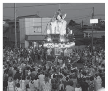
本川岸(天鈿女命) 天の岩戸の前で踊る天鈿女命。