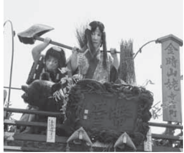
寺宿(金時山姥) 熊にまたがり馬の稽古をする金太郎と山姥。