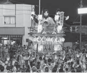
浜宿(武甕槌命) 鹿島神宮の御祭神。国土平定をする武甕槌命。