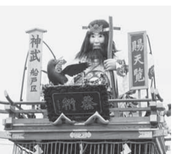
船戸(神武天皇) 東征の際、八咫鳥に導かれる神武天皇。

期間中は、小野川沿い新宿側の一部地域を含め、10時から22時まで大幅な交通規制が実施されます。 問い合わせ 商工観光課 ☎(50)1212