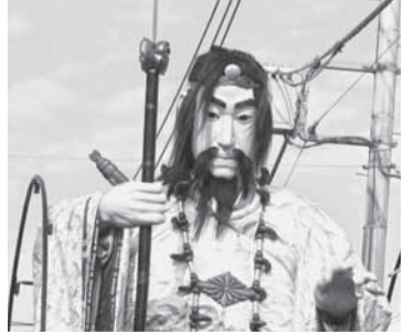
田宿(伊弉那岐尊) 鶺鴒から子作りを学ぶ伊弉那岐尊。