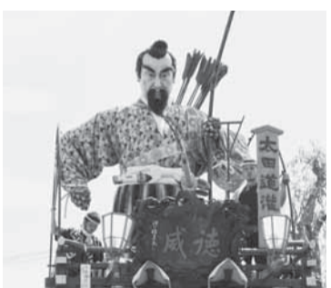
上仲町(太田道灌) 鷹狩りをする太田道灌。