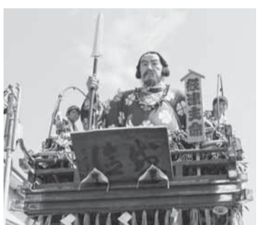
荒久(経津主命) 香取神宮の御祭神。国土平定をする経津主命。