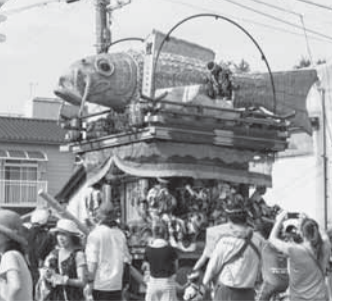
八日市場(鯉) 麦わらで作られた鯉。