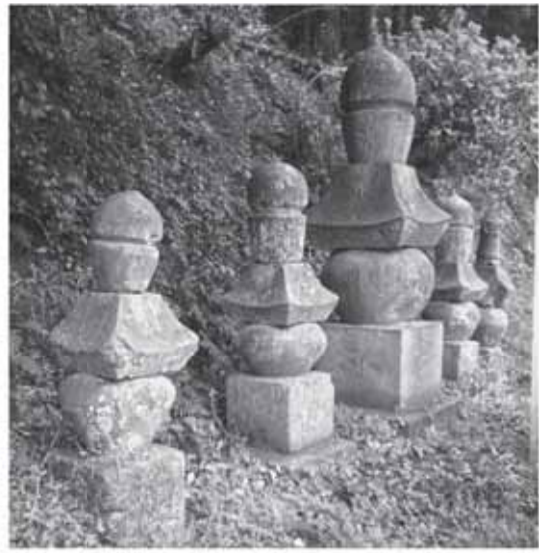
▲来迎寺(貝塚)の五輪塔