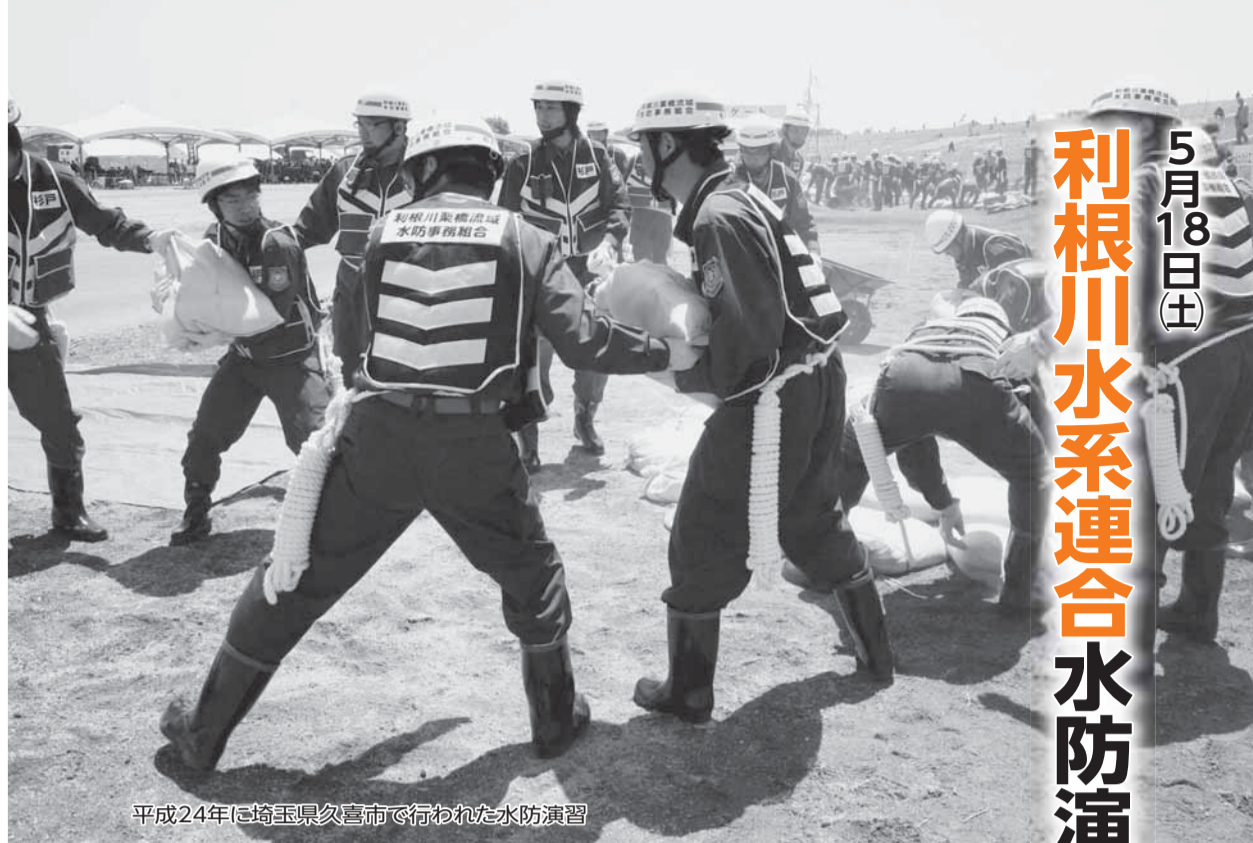
平成24年に埼玉県久喜市で行われた水防演習