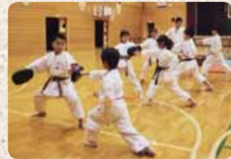
▲中段突きミット練習

千葉県警空手部瑞穂から改名。平成24年、日本スポーツ少年団から優秀団として表彰されました。全国中学生大会で優勝者を2回輩出し、また、全日本小学生大会で念願の優勝をしました。現在25人で活動しています。引っ込み思案の子どもも瑞穂の空手で成長できます。