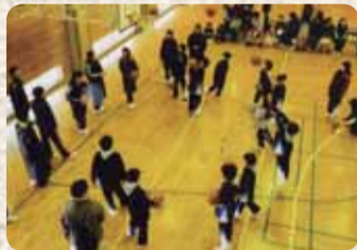
▲試合前のシュート練習

新メンバー男子6人、女子11人で挑んだ新人大会は、男子1勝、女子2勝と好スタートしました。毎週土・日曜日に小見川中央小学校と小見川西小学校の体育館で、みんなで楽しく練習に励んでいます。今年はチームワークを大切に1試合でも多く勝てるように頑張っていきたいです。