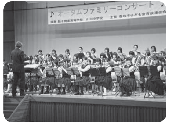
▲フィナーレは両吹奏楽部の合同演奏

山田中学校と銚子商業高校の吹奏楽部による演奏会は、息が合った合同演奏のほか、美しい歌声を披露した合同合唱や独唱、観客の中から参加を募り生の演奏をバックに歌ってもらう「生オケ」などを行い、来場者は心地よいひとときを過ごしました。