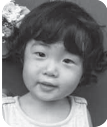
ひぐらし みつき 日暮 洗月ちゃん