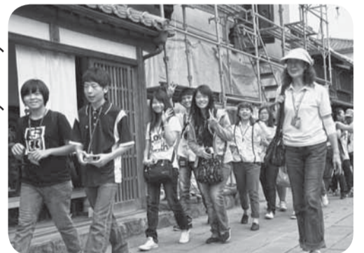
▲佐原の町並みを視察

帰国後は、香取市での体験や市の魅力をさまざまな形で発信することにより、相互のキズナが深まることを期待します。