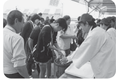
▲お米のすくい取り (水の郷さわら)