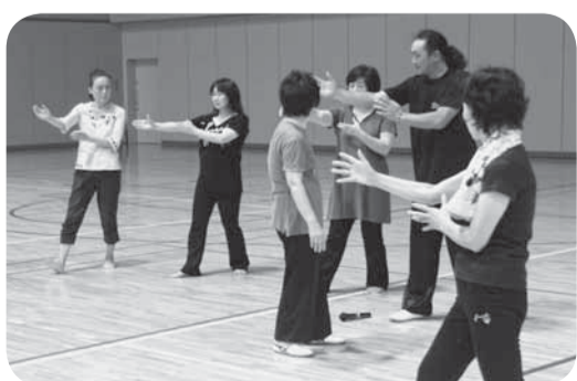
▲何事も基本は大事

9月から4回にわたって太極拳の基礎を学ぶ初心者太極拳教室が香取市民体育館で開催されました。およそ30人が参加し、立ち方や歩き方など、緩やかで流れるようにゆったりとした動きを行うことで、正しい姿勢や体の運用法などを学びました。