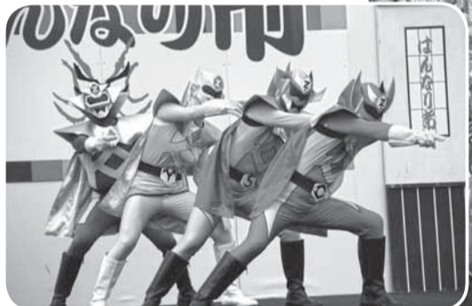
▲初披露のカトレンジャーZ

商業者など多くの出店者が「遊」「技」「芸」「食」に着目した市を繰り広げ、来場者と一体となって楽しむお祭り感覚のイベント「小見川はんなり市」が小見川駅前通りで開催され、多くの人でにぎわいました。 恒例となった小見くじ抽選会などの催しや、Mr. Daiの風船を使ったパフォーマンスのほか、特設ステージには香取市の新たなヒーロー「ふるさと戦隊カトレンジャーZ」が登場。今後の活躍が楽しみです。