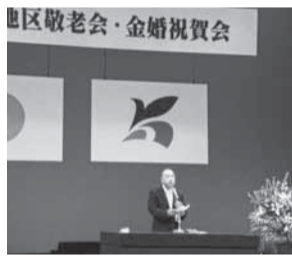
▲佐原地区敬老会・金婚祝賀会