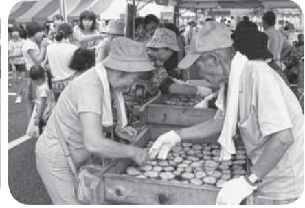
▲新サツマイモの試食会 (道の駅くりもと)