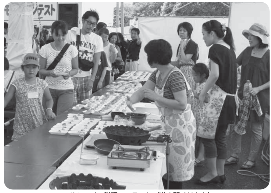
▲サツマイモ料理コンテスト (道の駅くりもと)

道の駅くりもと「紅小町の郷」で大創業祭が、9月15日から17日まで開催されました。16日には、特産品のサツマイモをテーマとした料理コンテストが行われ、5人のアイデア溢れる創作料理が披露されるなど、創業10周年を記念したイベントを盛り上げました。 また、道の駅水の郷さわらで大収穫祭が9月22日・23日に開催され、新米試食の食べ比べや果物直売などが行われました。 両会場とも、大勢の家族連れでにぎわい、おいしい秋の味覚を存分に味わいました。