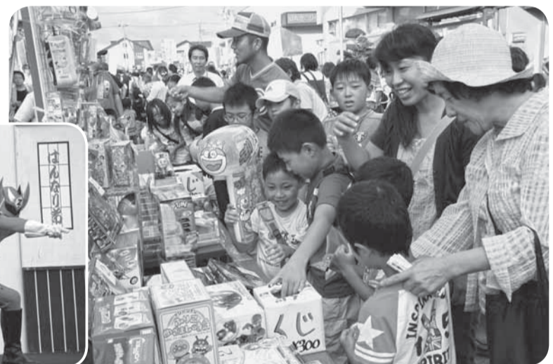
▲会場は多くの人でにぎわいました