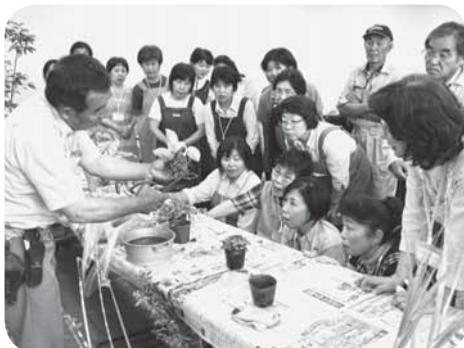
▲観葉植物の寄せ植えの講義を熱心に聞き入る

観葉植物の寄せ植え体験では、根の下を少し切るなどして、植物が長持ちするよう工夫しながら飾り付けました。