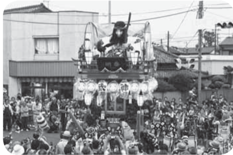
▲勇壮なの字廻し (写真は船戸区)