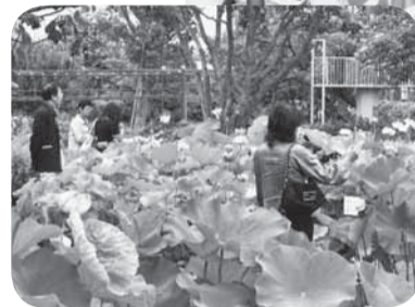
◀早朝の観蓮会には多くの人を訪れました