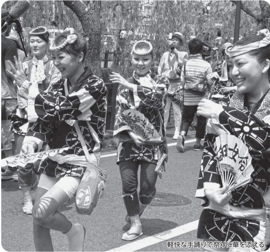
軽快な手踊りで祭りに華を添える

八坂神社の祭礼である、佐原の大祭夏祭りが、7月13日から15日まで行われ、佐原のまちに小江戸のにぎわいが蘇りました。13日には勇壮なの字廻しが披露され、14日には、整列した10台の山車が市内を巡行し、観光客の注目を集めました。