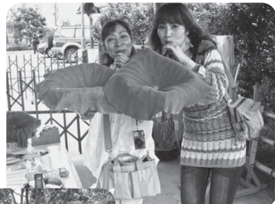
▲地酒を注いで楽しむ象鼻杯

6時から行われた早朝観蓮会では、咲き始めたばかりのはすの花を觀賞しようと、早朝にもかかわらず、多くの人を訪れました。