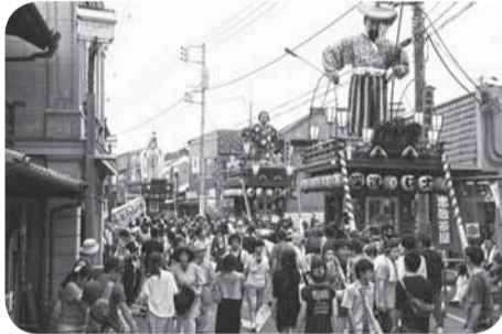
▲10台の山車が市内を巡行