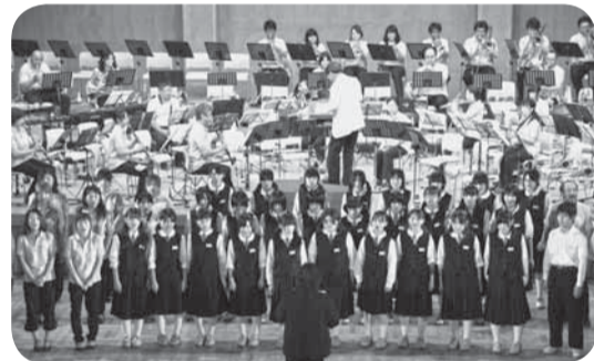
▲「負けないで」を合唱

合同演奏の最後には、応援ソングとして多くの人に親しまれる「負けないで」が観客も交え全員で合唱され、会場が一体となったコンサートとなりました。