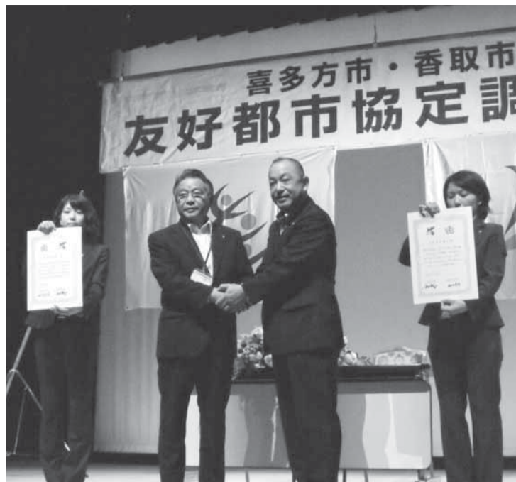
▲かたく握手を交わす山口喜多方市長(左)と宇井市長(右)