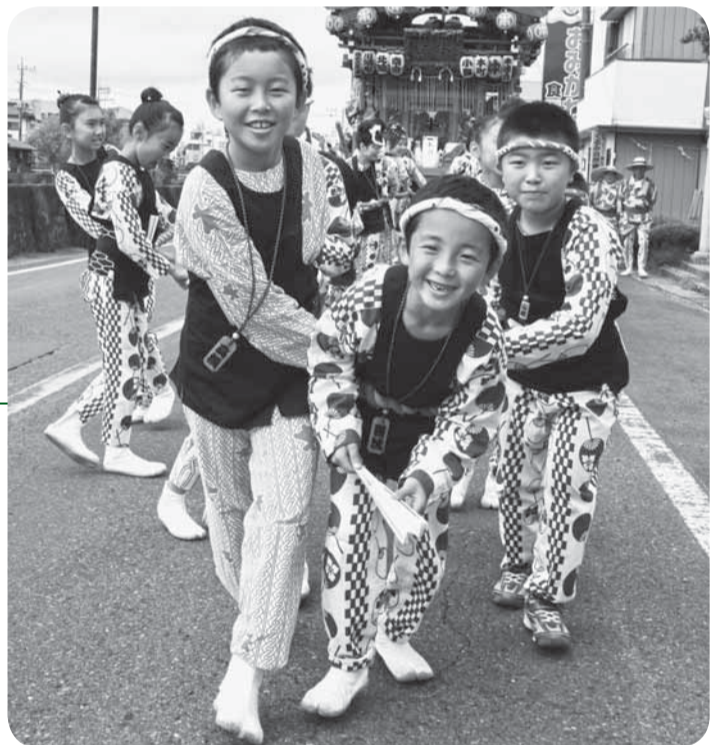
▲元気に綱を引く子どもたち