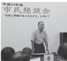
▲市民懇談会(小見川社会福祉センター)