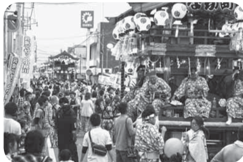
▲6台の屋台が一行に集結